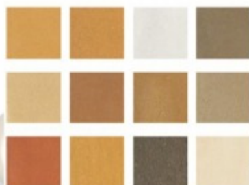
12 TEINTES DE BASE